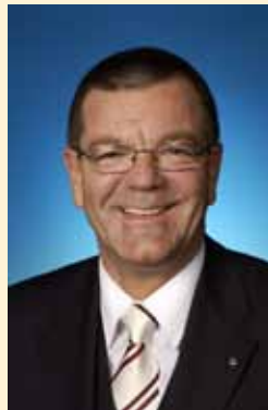
Gerd Krämer Landrat